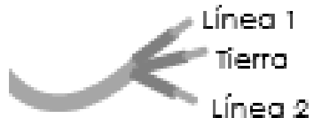
Figura N° 3 Conexión Eléctrica

En la Figura N° 3 muestra un diagrama que le ayudará a conectar eléctricamente su calentador.